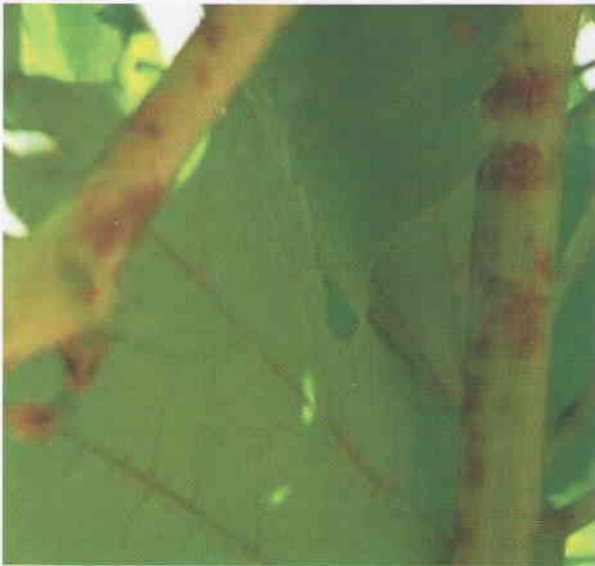
Obr. 8 Na obrázku sú letorasty viniča napadnuté múčnatkou viniča. Napadnutie je v podobe okrúhlych resp., podlhovastých škvrn tmavohnedej až čiernej farby.