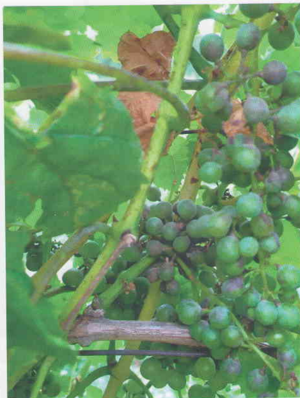
Obr. 14 Bobule hrozna napadnuté infekciou múčnatky. Po sporulácii mycélia sa bleďošedá farba napadnutého miesta na bobuliach zmenila na tmavošedú až čiernu. Na strapine a letorastoch sú viditeľné čierne škvrny po napadnutí múčnatkou.