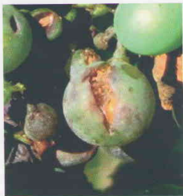
Obr. 15 Bobule napadnuté múčnatkou tvrdnú, praskajú a nakoniec vzniká prietrž (výron) semien.

tmavnú a opadávajú. Napadnutie súkvetia je často spojené s odumieraním strapiny.