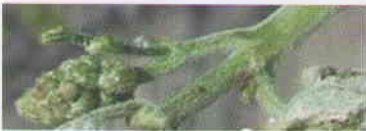
Obr. 10 Napadnutie súkvetia pred kvitnutím hubou Erysiphe necator .

tiež po ich zdrevnatení a majú výraznú tmavú farbu (obrázok 8). V mnohých prípadoch je v mieste čiernych škvrn popraskané a odumreté korkové pletivo (obrázok 9). Škvryny po múčnatke často zhoršujú vyzrievanie. Silne napadnuté letorasty môžu počas zimných mesiacov usychať, čo neraz spôsobí problém na jar pri reze viniča.