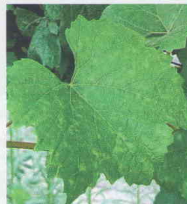
Obr. 1a List viniča napadnutý hubou Erysiphe necator (múčnatkou viniča). Na povrchu listu sú viditeľné svetlejšie zelenožlté škvrny huby