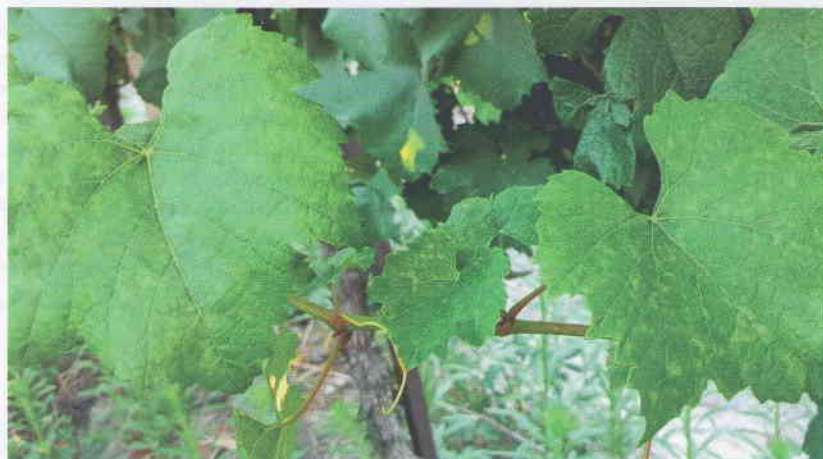
Obr. 1 Listy viniča napadnuté hubou Erysiphe necator (múčnatkou viniča). Na povrchu listov sú viditeľné svetlejšie zelenožlté škvrny huby

Mladé kolónie huby sa javia ako belavé a tie, ktoré ešte nesporulovali, majú kovový lesk. Spočiatku sú zväčša kruhové a majú priemer