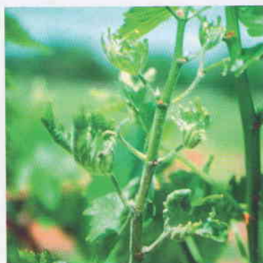
Obr. 6 Mladý letorast infikovaný skoro na jar múčnatkou viniča. Je to tzv. vlajkový výhonok, ktorý po infekcii múčnatky má pokrčené a zdeformované listy.