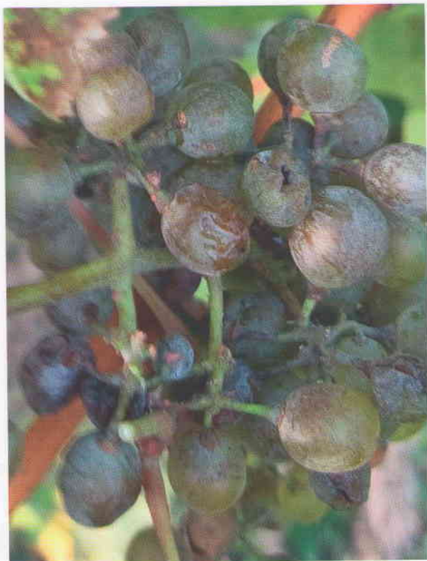
Obr. 13 Pri intenzívnom napadnutí bobúl hrozna múčnatkou, biele husto pokryté múčnaté kolónie huby zmenia po sporulácii farbu šupky na tmavošedú až čiernu. Bobule ďalej nerastú, tvrdnú a praskajú. Môžu sa na nich vytvoriť plodničky huby kleistotécia.