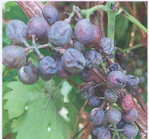
Obr. 9 Intenzívne napadnutie letorastov a bobúľ hrozna múčnatkou viniča. Bobule tmavnú a praskajú. Na obrázku vidíme popraskané korkové pletivo letorastu.