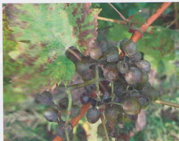
Obr. 5 Intenzívne napadnutie listov viniča a bobúľ hrozna. Listy viniča sa pri silnej intenzite múčnatky stáčajú smerom do vnútra. Bobule hrozna tmavnú, neskôr opadávajú.