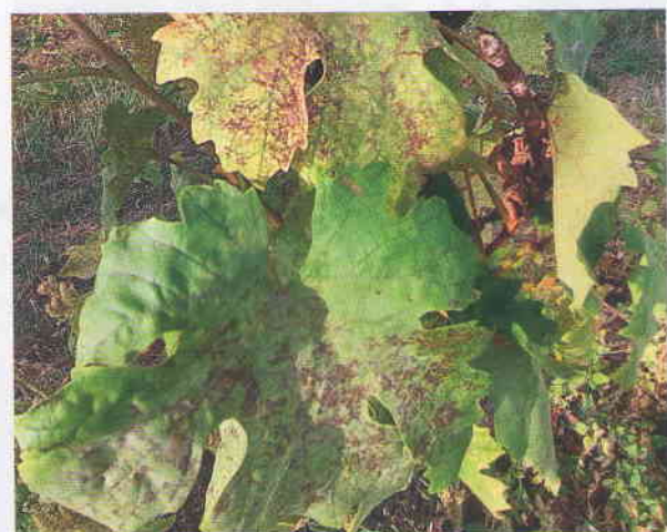
Obr. 4 Po napadnutí listov viniča múčnatkou sa sivobiely povlak viniča zmenil na tmavohnedý až čierny.

Múčnatka napadá skoro na jar aj mladé letorasty, už vo vývoji prvých listov. Infekcia závisí od prezimovania spiacich hýf mycélia, ktoré prežijú vo vnútri púčikov viniča hroznorodého. Hneď na začiatku, po pučaní a rozvinutí 1-3 listov, môžu byť letorasty napadnuté hubou. Príznaky sa objavujú na mladých letorastoch (výhonkoch) a zároveň aj na vyvinutých listoch. Mladé listy na týchto letorastoch sú skrútené, pokrčené, zdeformované a zvädnuté. Napadnuté letorasty s vyvíjajúcimi sa listami sú nazývané „vlajkové výhonky“ (obrázok 6). Tento názov vznikol na základe príznakov mladých výhonkov (letorastov) s mladými listami, ktoré vo vinohrade po zvädnutí listov vytvárajú tvar vlajky. U nás sa týmto typom vlajkových výhonkov stretávame len ojedinele. Vyskytuje sa v teplejších regiónoch. Príznaky po napadnutí múčnatkou sa u nás začínajú objavovať na letorastoch neskôr a spočiatku vytvárajú bledé kolónie mycélia huby, ktoré v dôsledku produkcie spór huby Erysiphe necator postupne nadobúdajú sieťovitú kresbu v tvare pozdĺžnych tmavých škvrn, ktoré sú pokryté slabo viditeľným povlakom mycélia (obrázok 7). Škvry zostávajú na letorastoch aj počas vyzrievania letorastov,