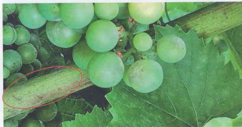
Obr. 7 Letorast viniča a bobule hrozna napadnuté múčnatkou viniča. Na letorastoch sa po napadnutí hubou Erysiphe necator objavujú bledohnedé škvrny. Škvry neskôr tmavnú.