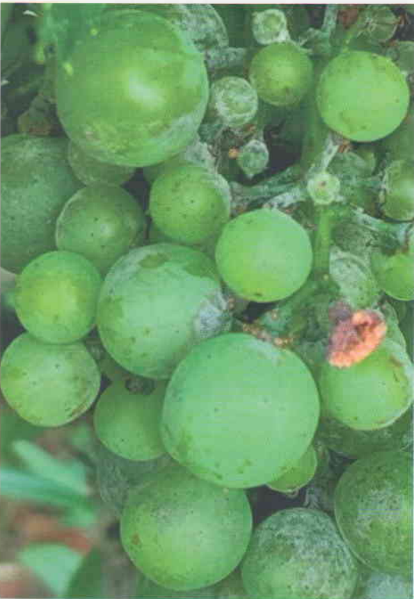
Obr. 11 Napadnutie bobúľ hrozna a strapiny múčnatkou viniča. Bobule a strapina sú pokryté bielym práškom mycélia huby.

V tejto fenologickej fáze sú mladé zárodoky súkvetia viniča na napadnutie múčnatkou veľmi citlivé (obrázok 10). Príznaky na súkvetí sú spočiatku takmer voľným okom neviditeľné. Napadnutie možno spozorovať až vtedy, keď je súkvetie alebo rozvinuté kvietky pokryté belavou plesňou. Napadnuté kvietky hnednú,