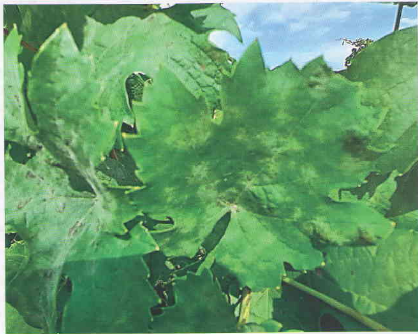
Obr. 3a Listy viniča napadnuté múčnatkou. Na listoch sa objavuje belavý slabo viditeľný sivobiely povlak mycélia huby Erysiphe necator .

Múčnatka napadá skoro na jar aj mladé letorasty, už vo vývoji prvých listov. Infekcia závisí od prezimovania spiacich hýf mycélia, ktoré prežijú vo vnútri púčikov viniča hroznorodého. Hneď na začiatku, po pučaní a rozvinutí 1-3 listov, môžu byť letorasty napadnuté hubou. Príznaky sa objavujú na mladých letorastoch (výhonkoch) a zároveň aj na vyvinutých listoch. Mladé listy na týchto letorastoch sú skrútené, pokrčené, zdeformované a zvädnuté. Napadnuté letorasty s vyvíjajúcimi sa listami sú nazývané „vlajkové výhonky“ (obrázok 6). Tento názov vznikol na základe príznakov mladých výhonkov (letorastov) s mladými listami, ktoré vo vinohrade po zvädnutí listov vytvárajú tvar vlajky. U nás sa týmto typom vlajkových výhonkov stretávame len ojedinele. Vyskytuje sa v teplejších regiónoch. Príznaky po napadnutí múčnatkou sa u nás začínajú objavovať na letorastoch neskôr a spočiatku vytvárajú bledé kolónie mycélia huby, ktoré v dôsledku produkcie spór huby Erysiphe necator postupne nadobúdajú sieťovitú kresbu v tvare pozdĺžnych tmavých škvrn, ktoré sú pokryté slabo viditeľným povlakom mycélia (obrázok 7). Škvry zostávajú na letorastoch aj počas vyzrievania letorastov,