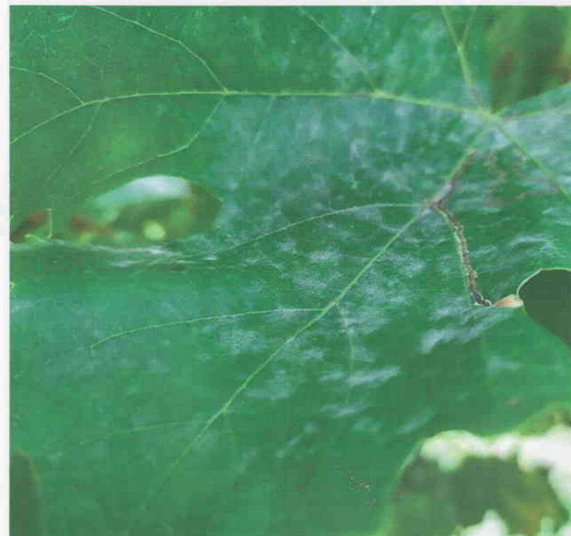
Obr. 2 List viniča po napadnutí hubou Erysiphe necator . Na liste sú kolónie huby s belavým povlakom, ktoré majú pred sporuláciou kovový lesk.

od niekoľkých milimetrov do centimetra alebo viac a môžu sa vyskytovať jednotlivo aj v skupinách, ktoré sa spájajú a pokrývajú veľkú časť listu. Starnúce kolónie sú sivasté a môžu niesť kleistotécia v rôznych štádiách vývoja.